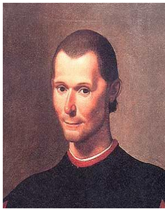
Nicolau Maquiavel (3.05.1469-21.06.1527 ) Itália