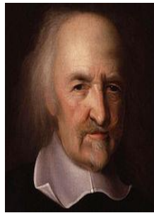
Thomas Hobbes (5.04.1588 – 4.12.1679) Reino Unido